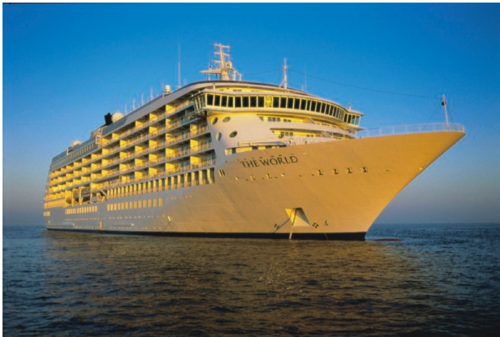
The World er ikke som de fleste krydstogtskibe, idet man f.eks. ikke kan bestille et 14 dages krydstogt, men blot købe en lejlighed om bord.

Kan man forlænge den særlige krydstogtfølelse til hele året rundt? Ja, om bord på The World, der er verdens største lejlighedskompleks til søs. Eneste ulempe: Kun adgang for virkelige velhavere