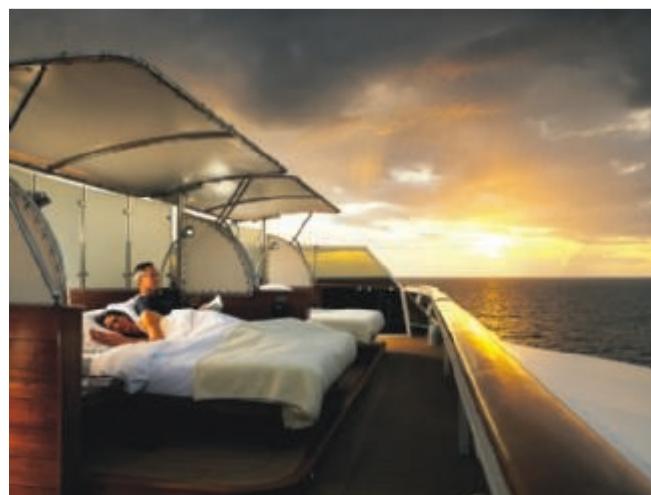
Et af de populære steder på The World er ude i stævnen, hvor der er indrettet balinesiske senge under åben himmel.

Et hurtigt blik i en af de udleverede brochurer fortæller